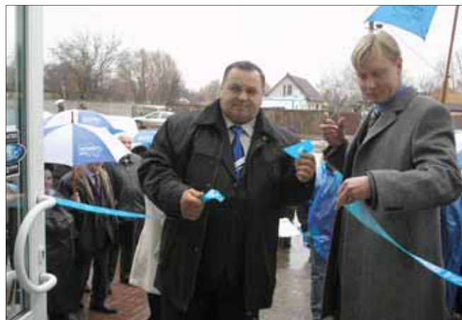
Відкриття громадської приймальні в м. Бориспіль