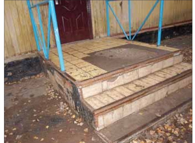
Ось вони, перші сходи до дорослого життя. На жаль, не дуже охайні.