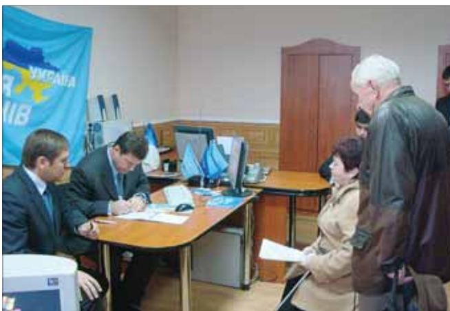
На прийом у Білій Церкві прийшло чимало людей