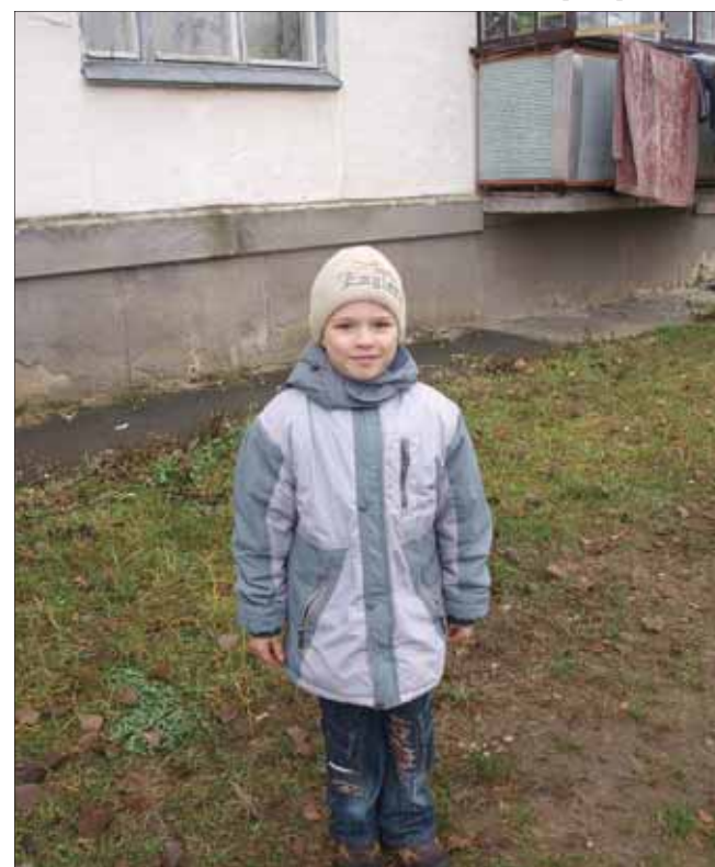
Маленький мешканець військового містечка: «Все одно хочу бути військовим!»

автобуса до Семиполків. Але все це спростовують батьки з ініціативної групи. На їхню думку, влада надала народним депутатам інформацію, яка не зовсім відповідає дійсності, і