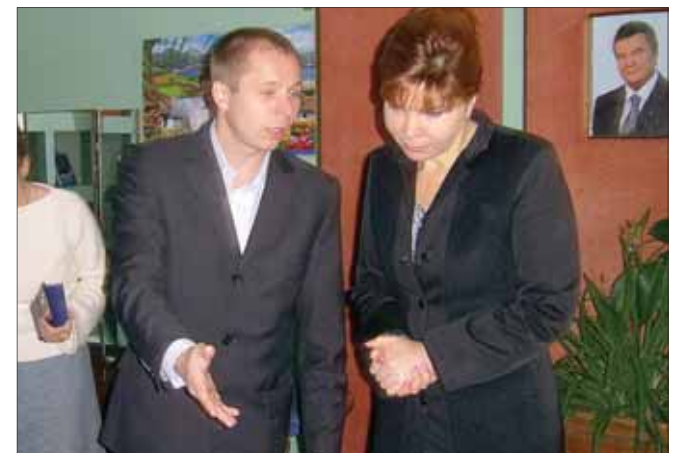
Народний депутат Тетяна Засуха вислуховує проблеми громадян