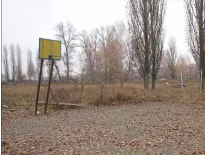
На спортивному майданчику — порожньо

знаходиться в містечку, з кожним роком приходять все менше першачків. Цей факт яскраво свідчить про те, що більшість батьків, обираючи між військовою службою та