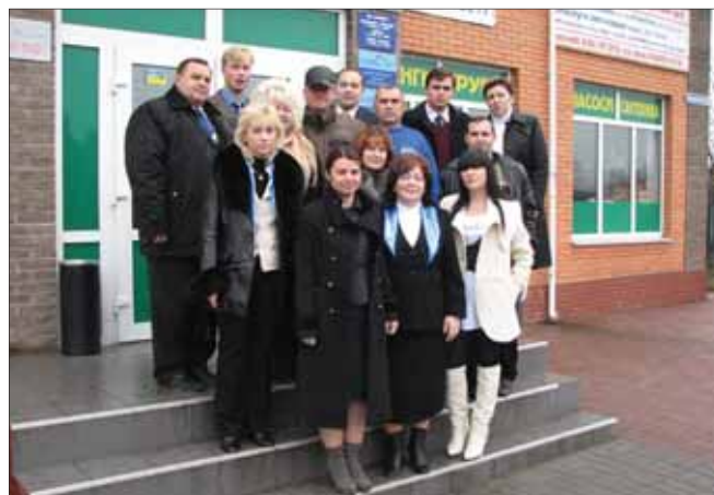
Колектив громадської приймальні в м. Бориспіль