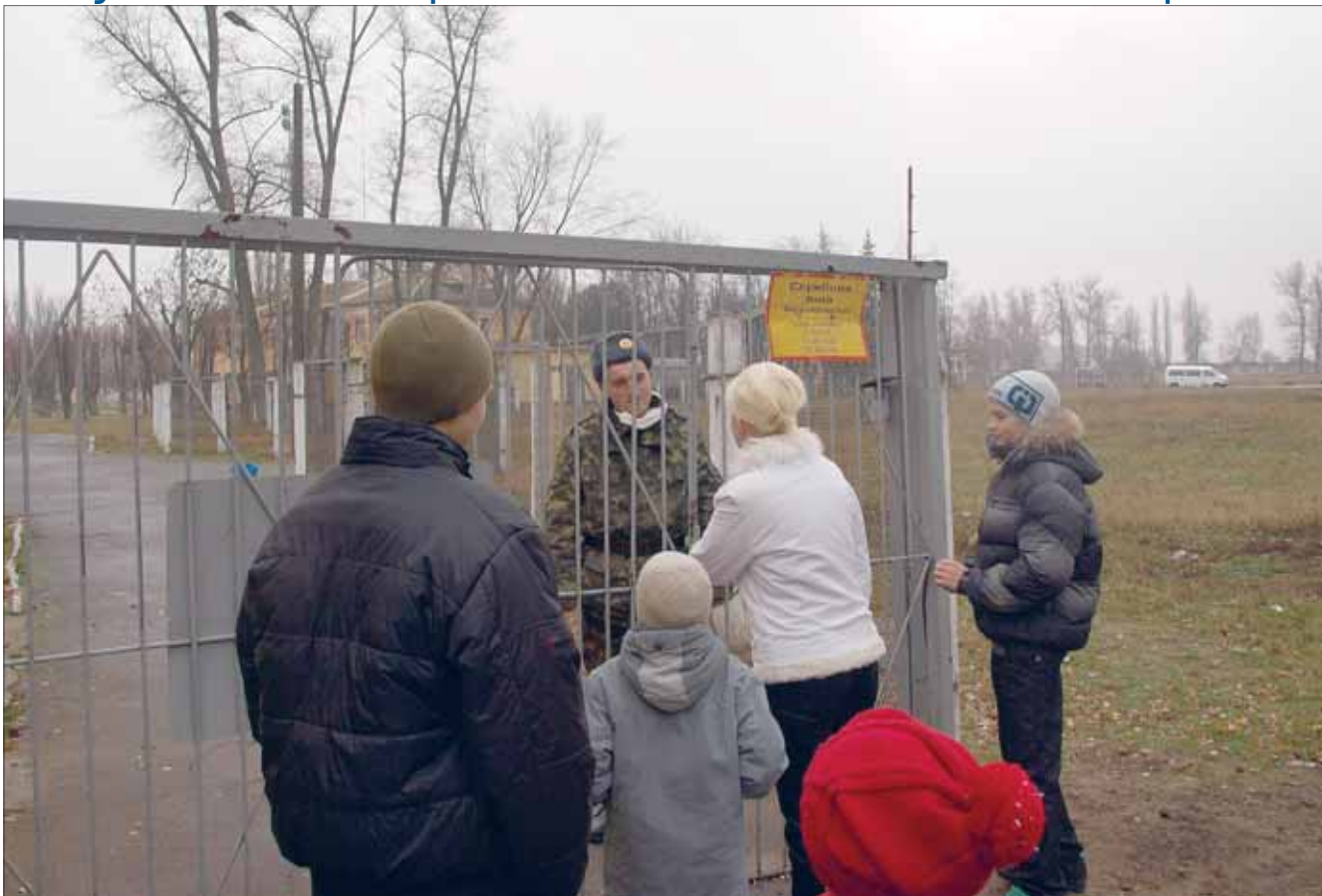
Юні мешканці Семиполків хочуть пройти на спортивний майданчик

Український парадокс: діти військових бажають служити державі, яка не дбає про якість їхньої освіти.