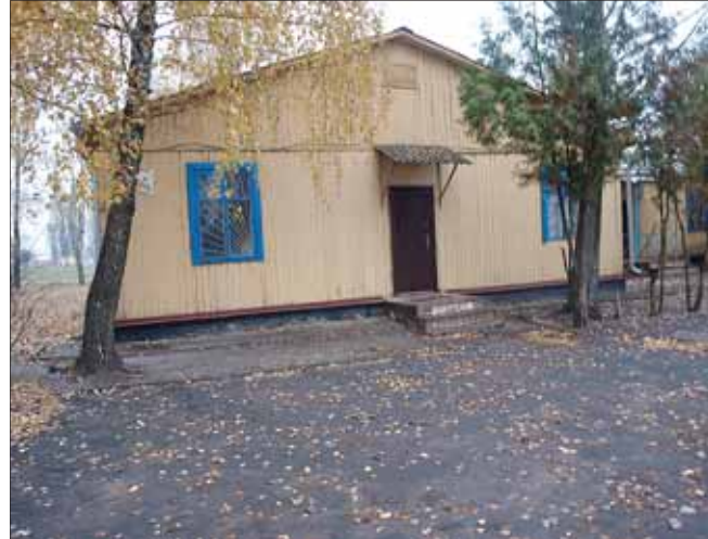
Початкова школа у Семиполках