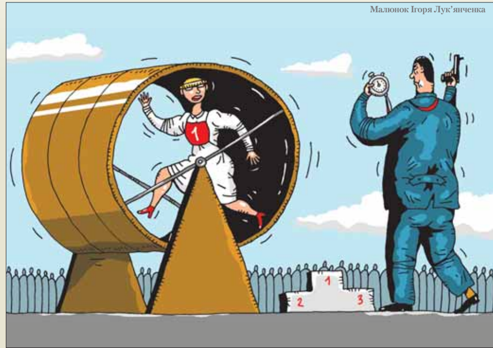
Малюнок Ігоря Лук'яненка

за сто днів не наведе порядок в країні, то через сто днів ми підніmemo всю країну», – заявив Голова Партії регіонів.